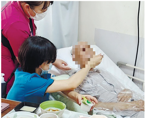
【写真1】食事時のチーム活動状況

次回、加齢に伴う筋力低下による摂食嚥下機能の低下などについて説明させていただきます。