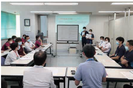
発災後の対策会議はなるべく早期に開催する必要があります