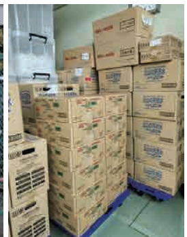
非常用の食料などは3日分を用意します