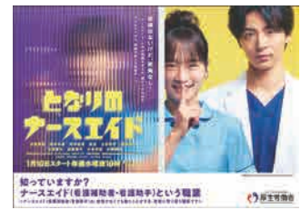
厚生労働省のタイアップポスター

私たちが微力ながら職種紹介として取り上げてみました。看護補助者のことをより知っていただけましたら幸いです。