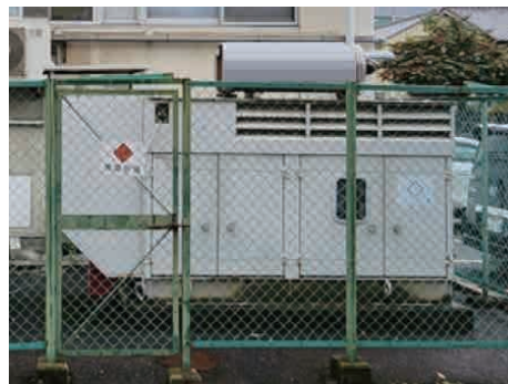
自家発電装置は停電時でも電気を供給してくれます