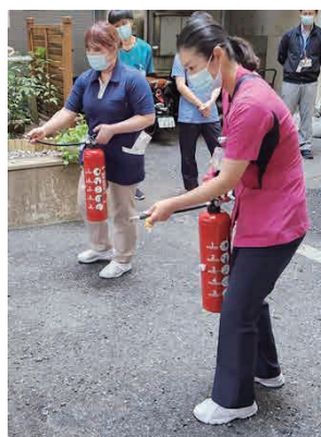
消火器の使用訓練です

火災がいつ発生しても落ち着いて対応できるように訓練を継続し、安全な医療環境を確保します。