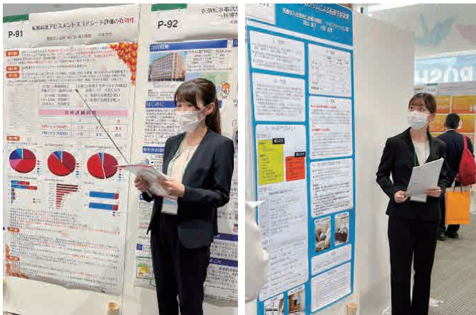
参加した2名の発表の様子です