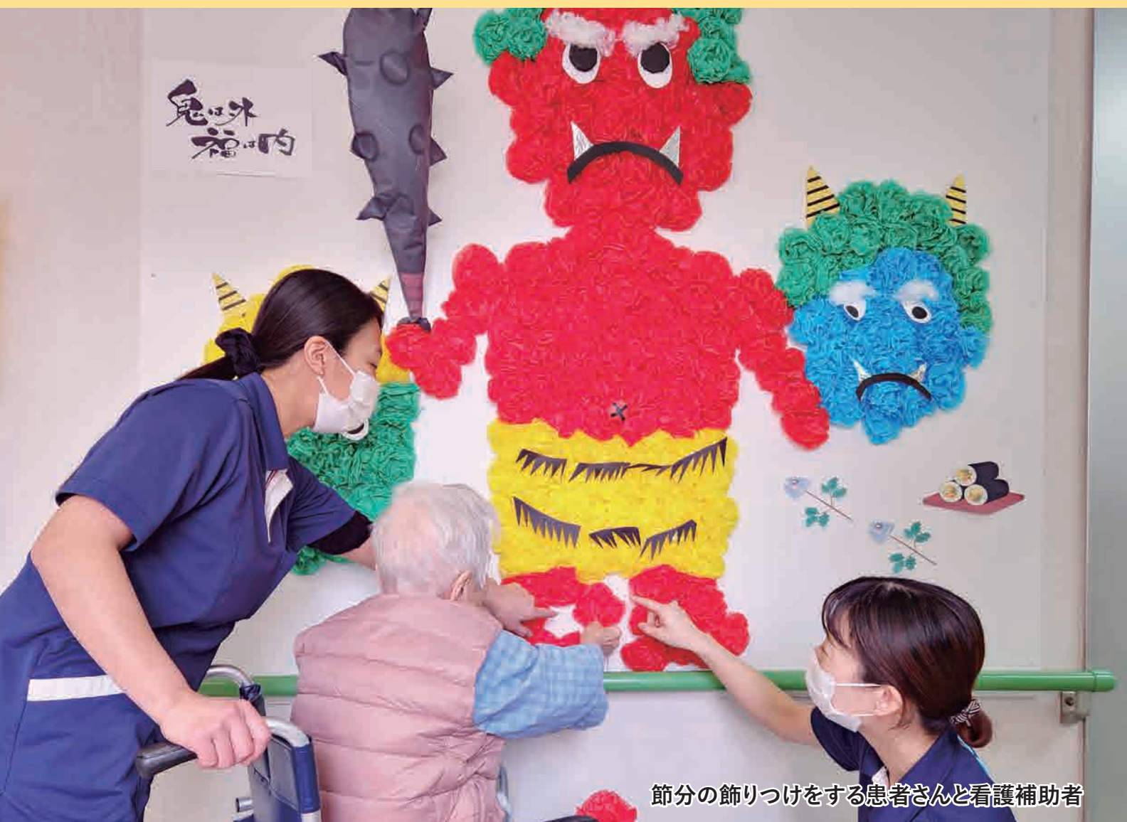
節分の飾りつけをする患者さんと看護補助者