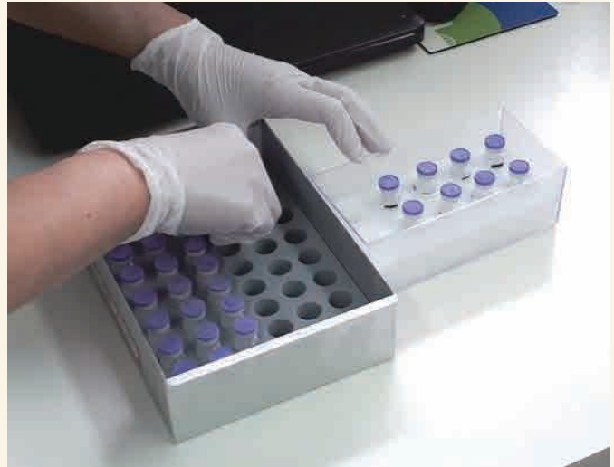
保管温度も含めワクチンの管理は厳重に行います

新型コロナウイルスが猛威を振るう中、国を挙げての感染拡大防止に少しでも貢献すべく、4月15日より連携型接種施設として当院職員や地域の医療従事者を対象に、新型コロナワクチン接種を開始しました。通常の診療業務の合間を縫っての接種になるため、なかなか多くの方への実施が難しいところではありますが、ひと月に700回以上接種する月もありました。かかりつけ患者さんを中心として、できる限りの地域貢献を行いたいと考えております。