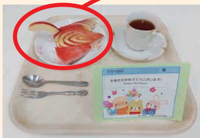
誕生日をお祝いして……