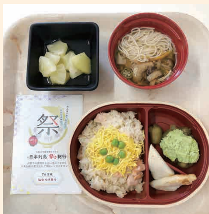
年間イベント食は見た目も大事に

管理栄養士と厨房委託業者の2人3脚で、あの手この手を駆使して、これからも楽しく食欲がわくような食事を提供していきます！