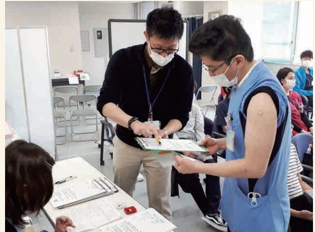
接種後、状態に応じた体調観察を実施