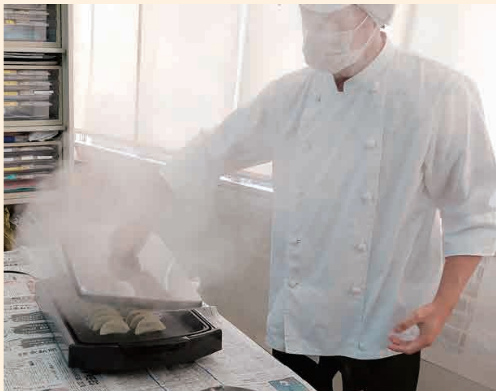
調理実演では美味しそうな湯気の香りも楽しみです