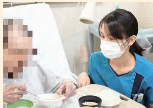
多職種で支援を行います

食べることで喜びや幸せを感じていただけるような支援は、治療食としての食事の大事な側面だと考えて取り組んでいます。