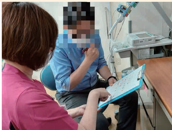
分かりやすい「食品アレルギー確認シート」を用いてチェックします