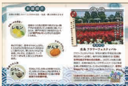
メニューの内容も丁寧にお伝えします