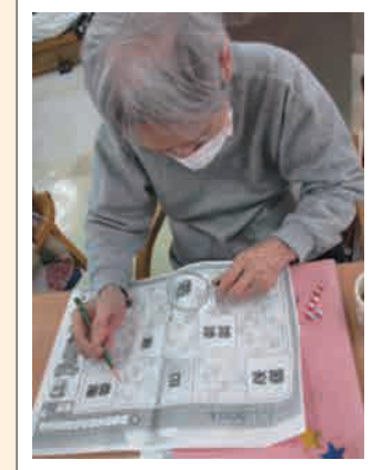
真剣に取り組まないと解けません