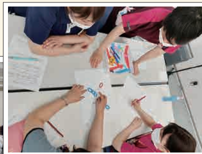
課題にグループで取り組みます

今回の医療安全研修は、活動目標「規則と手順 決めて守って見直して 先の危険を回避しよう」に沿った内容で実施しました。違う部署、違う職種のスタッフが集まってグループを作り、グループ内でのディスカッションを通じて風通しの良い組織を作っていきます。これは、より安全な医療を提供する上で重要な事だと考えております。