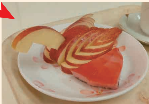
分かりますか？ リンゴで作った白鳥です！