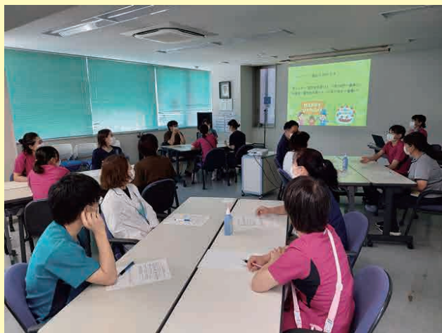
グループワークから機器の使用訓練まで様々な形の研修を行います