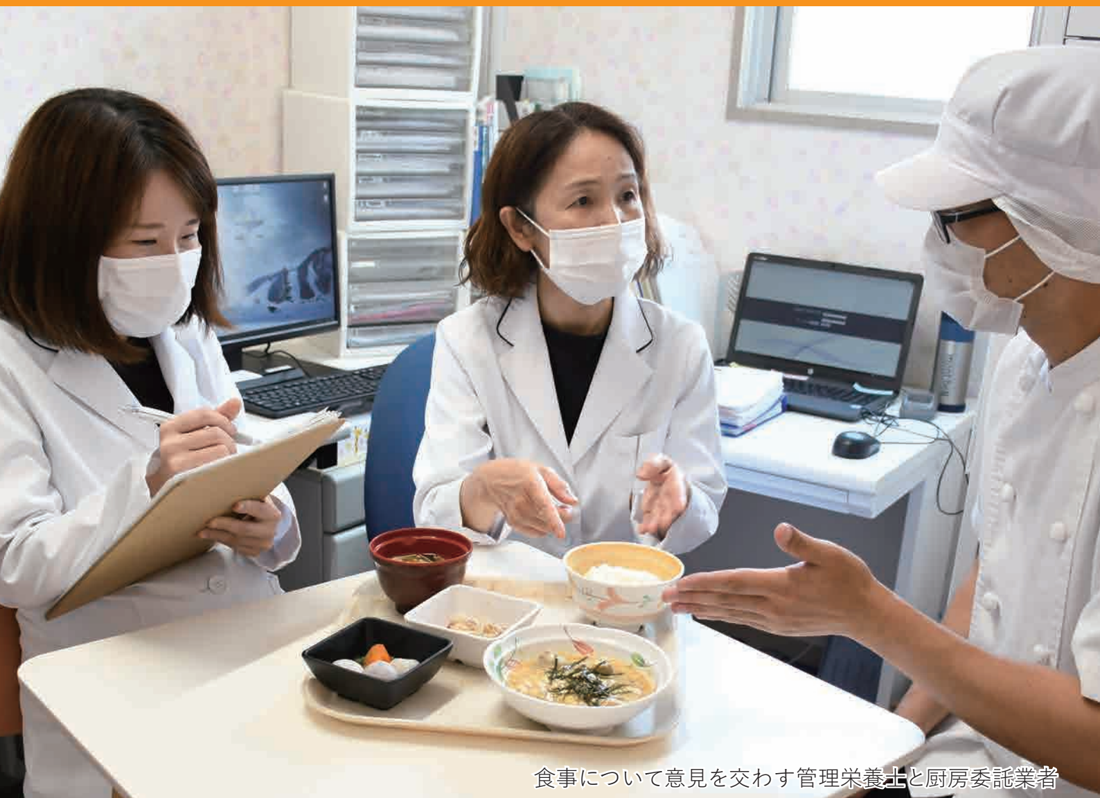
食事について意見を交わす管理栄養士と厨房委託業者