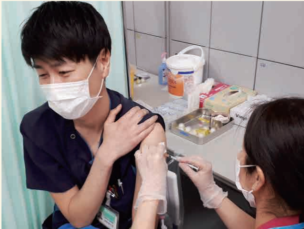
ワクチン接種の様子