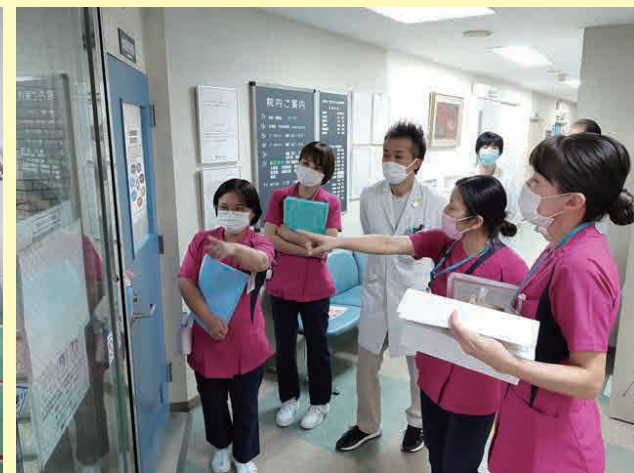
院内のラウンドも重要な業務です