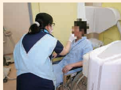
検査を通じて食形態を判断します

摂食・嚥下チームとも共同し、嚥下状態の検査結果に応じてキザミ食、ミキサー食など、トロミの有無も踏まえて適切な食事の提供を行い、誤嚥性肺炎を予防します。