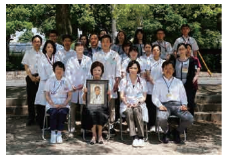
開設記念の写真(2020年撮影)