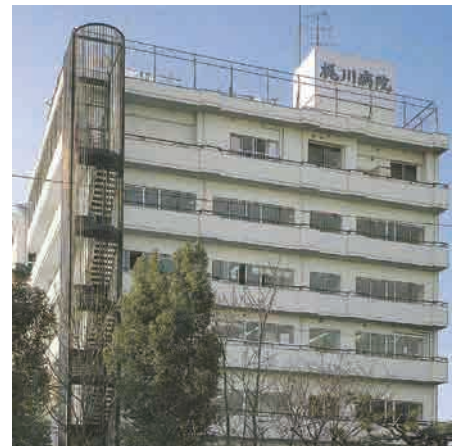
開院10周年時の新館(1990年撮影)