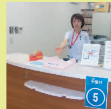
⑤中受付カウンター上に 受付票を置きます