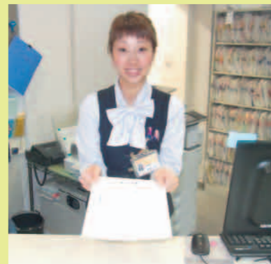
①総合受付で順番を取り 受付票を発行します