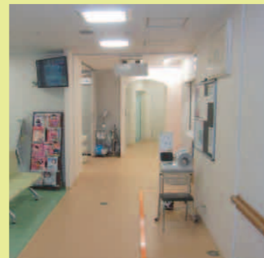
③ここが外来入口です