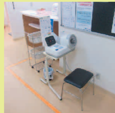
④体を落ち着かせてから 血圧を測ります