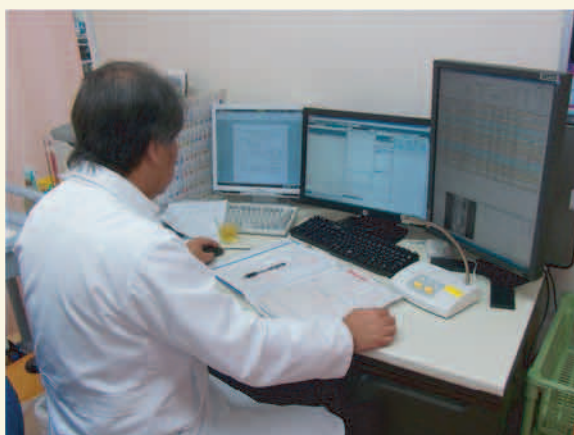
医師がオーダリングシステムに入力し、

もう少し簡単に言いますと、検査内容や薬の処方について、これまでは医師が手書きでやっていたものを、コンピュータに入力することで、診療から医事会計までの処理・業務が迅速化する、というものです。まだ操作が未熟なため、患者さんに大きなメリットが出るまでには至っていませんが、もう少し時間がたてば、その効果が出てくるものと思います。どうぞご期待下さい。