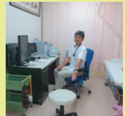
⑥マイクでお名前が呼ばれ 診察が始まります