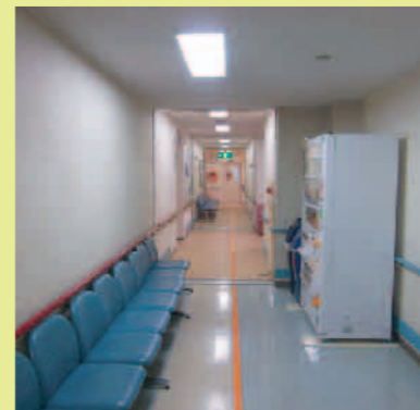
②床のオレンジ色の線に沿って 進んでください