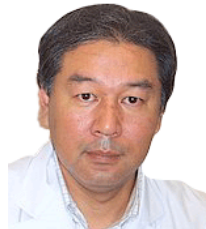
先月は免疫療法全般および活性化自己リンパ球療法について概説さ

せていただきました。今月は活性化自己リンパ球療法の適応、すなわち、どのようながん患者さんに対してどのような効果があるのかについて解説したいと思います。