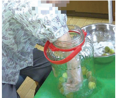
【写真5】梅干しを漬ける

【在宅生活支援】 自立した在宅生活が継続できるような総合的に支援し、家族の介護負担の軽減に努めることも、役割の1つです。